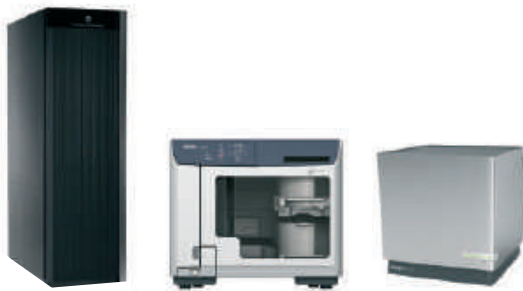
Server- & Storage-Lösungen mit optimaler Brennrobotik