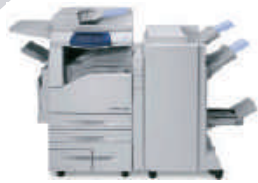
Ökonomische Papierprints im A3 und A4 Format