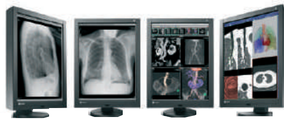
Betrachtungsstationen / praxis- & klinikweite Bildverteilung