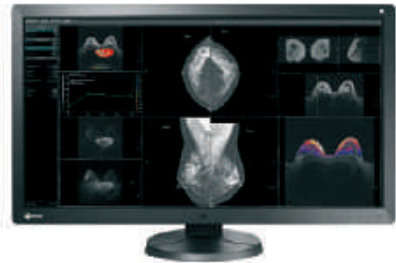
Diagnostic- & Mammografie-Workstations mit Befundungsmonitoren